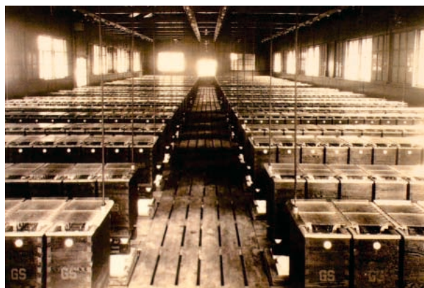
高野山電鉄細川変電所に納入した据置用電池（1930年）

昭和27年（1952年） 『据置蓄電池（開放型）』（JIS C 8703）が制定されました。