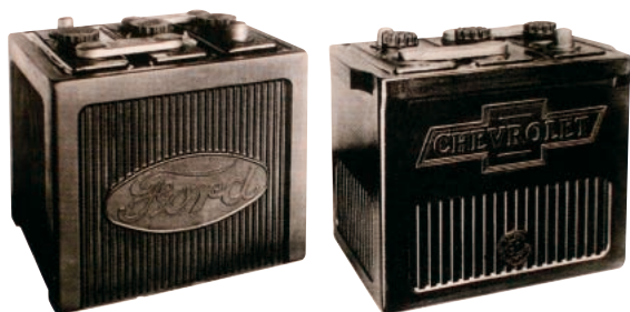
フォード用(左)・シボレー用(右)自動車電池

製品規格は、技術の進歩など時代と共に変化して行くもので、制定後は定期的に審議され、「確認-改正-廃止」等の手続きが取られています。