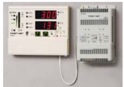
「デマンド監視装置 RMD501シリーズ」(左)デマンド表示板、 (右)デマンド監視装置本体