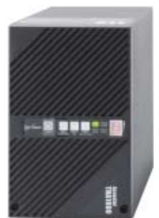
交流無停電電源装置(UPS) 「Acrostar THA1000-10」