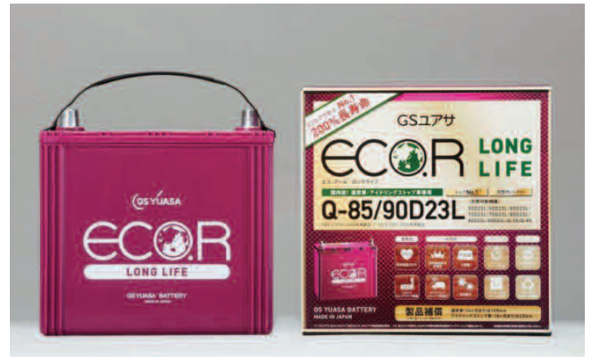
ECO.R LONG LIFE (写真はEL-90D23L/Q-85)

み、ハイブリッド車やIS車など次世代のエコカーが次々と市場へ投入されております。なかでもIS車は軽自動車を中心に急速に普及が拡大しており、バッテリーにおいても新たなニーズが生まれつつあります。